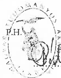
Pálincás József, az MTA elnöke